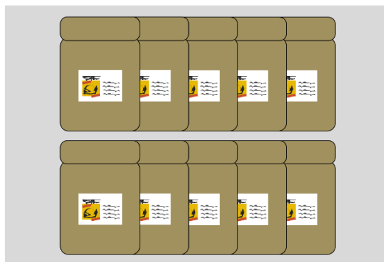
図2：散布したすべての薬剤の空袋数がわかる写真