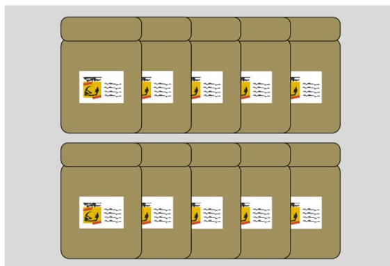
図2：散布したすべての薬剤の空袋数がわかる写真